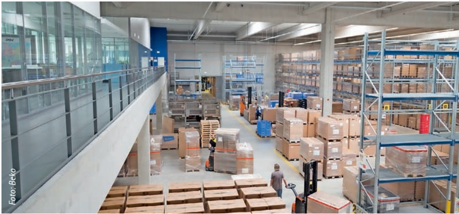
Von der Büroempore aus kann man in die neue Logistikhalle schauen.